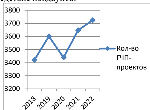
Рис. 1. Количество ГЧП-проектов на различных стадиях реализации в соответствующем году

произошло большого количества проектов, начало реализации которых было отложено вследствие локдаунов.