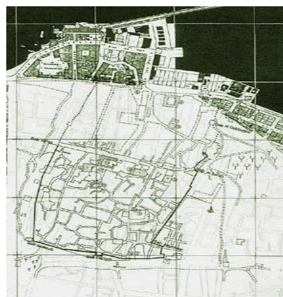
Рисунок 3. Бейрут в исламский период, Хала Нахас [3]

Схема поляризации градостроительной структуры, предложенная Институтом исследований и профессиональной подготовки в целях развития (IRFED: Международный центр развития и цивилизаций), отражает этот подход.