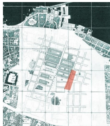
Рисунок 2. Римский план Бейрута (64 г. до н.э. - 395 г. н.э.), Хала Нахас [3]

Основная часть. Бейрут является одним из важнейших портов на восточном побережье Средиземного моря. На протяжении всей истории город подвергался множеству войн, которые привели к повсеместному разрушению ливанской инфраструктуры и социальной ткани. Чтобы восстановить город и возродить его наследие, восходящее к эпохе Римской империи (64 г. до н.э. - 395 г. н.э.) (Рис. 2) реализован ряд управленческих решений, начиная с эпохи независимости от французского колониализма в 1943 г. В 1960 г. началось первое развитие с использованием политики полюсов роста (Рис. 3).