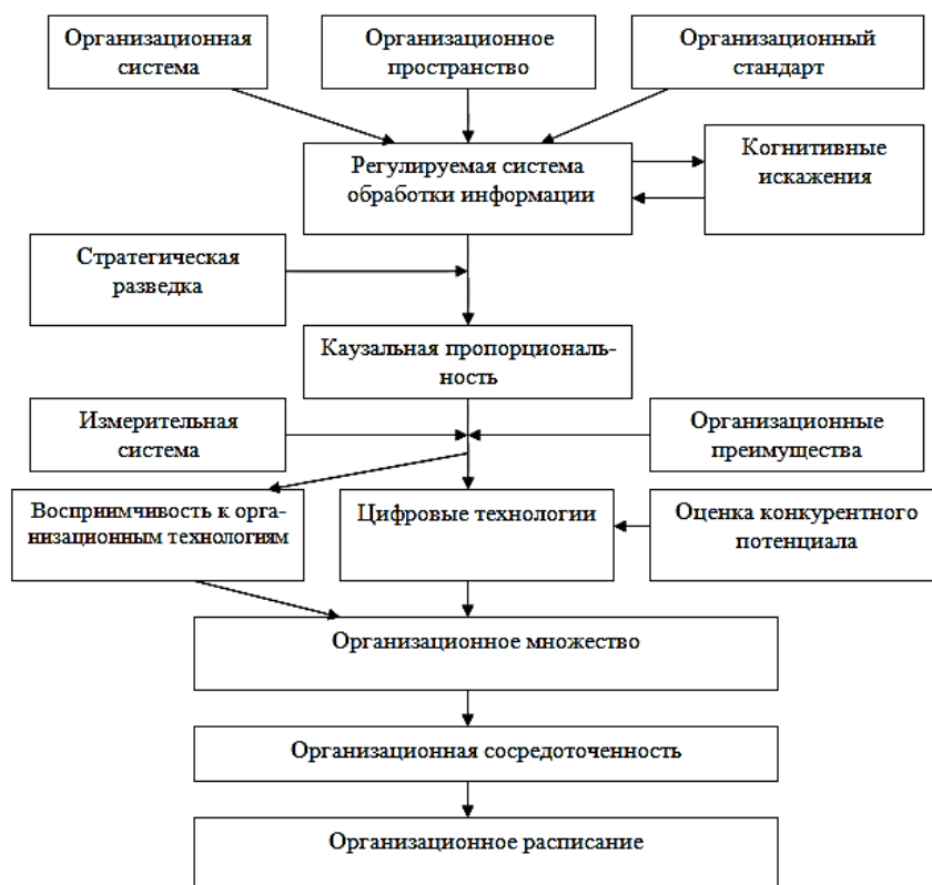
Рис. 2. Последовательная процедура реализации организационных технологий конкурентоспособного производства

Измерительная система как видно на рис. 2 предназначена установить пригодность выбранных процедур, а также для выявления достоинств и недостатков при выборе направлений их усовершенствования. Адекватный выбор направлений по изменению организационных технологий и их приживаемости возможен только при условии, если характеристики реализуемой совокупности измерены.